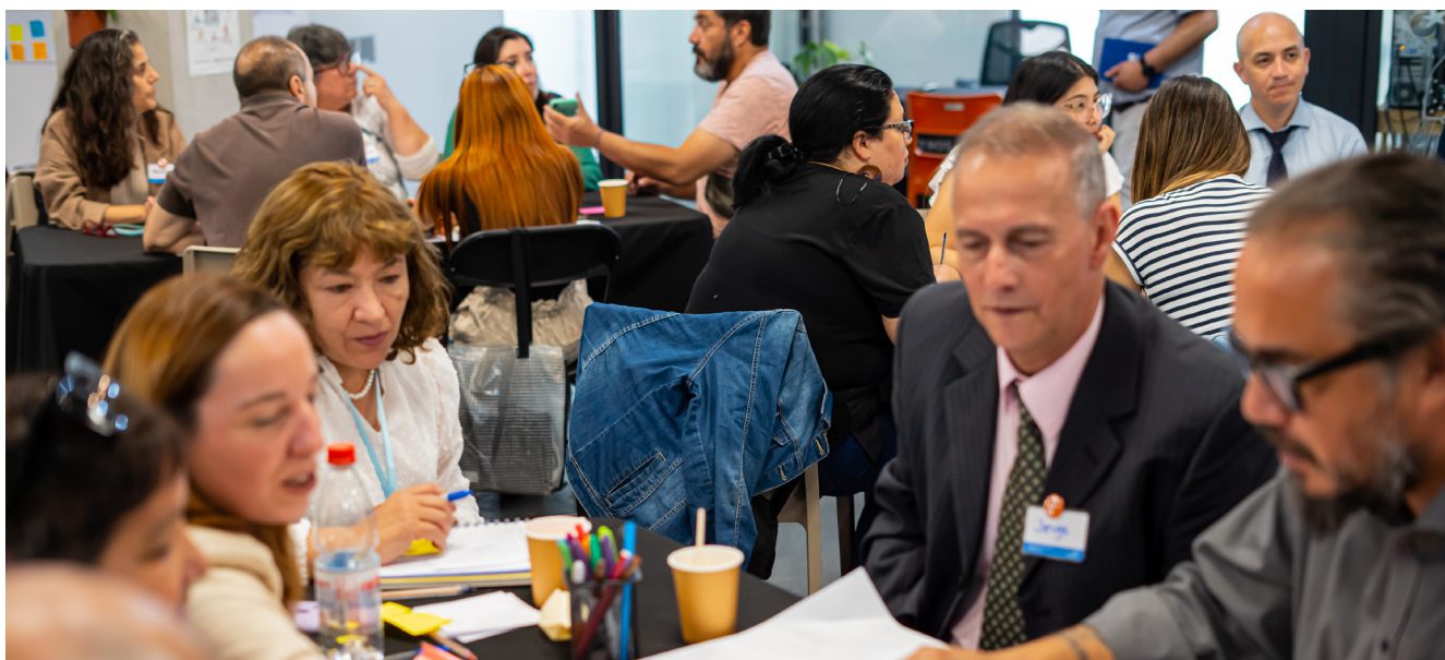
■ Espacio participativo presencial